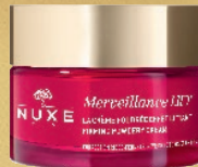
LA CRÈME POUDRÉE EFFET LIFTANT