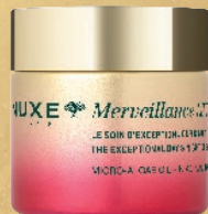
LE SOIN D'EXCEPTION JOUR & NUIT