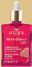
LE SÉRUM-EN-HUILE ACTIVATEUR DE FERMETÉ

POUR COMPLÉTER CES DEUX GRANDES INNOVATIONS, SUCCOMBEZ À L'ENSEMBLE DE LA COLLECTION MERVEILLANCE LIFT