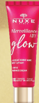
LA CRÈME BONNE MINE EFFET LIFTANT