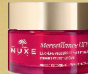
LA CRÈME VELOURS EFFET LIFTANT