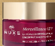
LA CRÈME CONCENTRÉE DE NUIT